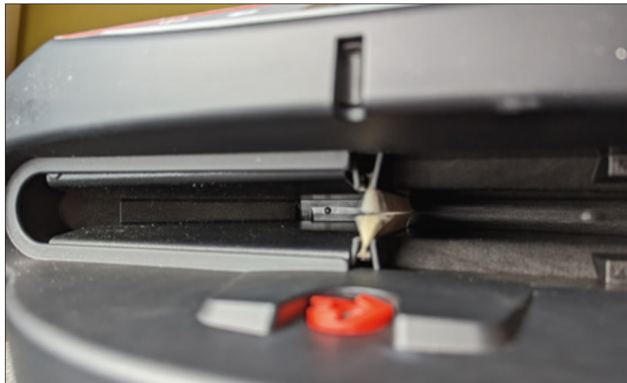
Die Wanne der Knosti Disco-Antistat Ultrasonic 2.0 ist nun mit Fiberglas verstärkt. Dadurch ist sie noch besser gegen Auslaufen geschützt

marktplatten mitgebracht. Mit diesen testeten wir gleich die neue Knosti Plattenwaschmaschine und waren mehr als nur angetan. Alle Flecken, selbst die sehr hartnäckigen, waren verschwunden. Und der Klang der Schallplatten war natürlich nach der Reinigung wesentlich besser. Zudem lässt man ja die Nadel des Tonabnehmers nur sehr ungern über eine schmutzige Platte laufen. Darüber hinaus konnten wir auch aus scheinbar sauberen und fabrikneuen Schallplatten noch ein wenig mehr Detailklang herauskitzeln, wenn wir sie vorher mittels Ultraschall reinigten. Schon beeindruckend, was man hier noch herausholen kann – im wahrsten Sinne des Wortes! ■